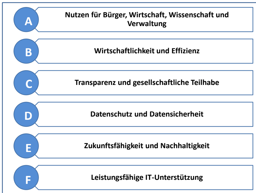
Abbildung 2: Zielsystem der NGIS

Die NGIS orientiert sich an der nationalen E-Government-Strategie und stellt einen angestrebten Zustand dar.